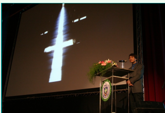
圖說：安藤忠雄大師介紹其作品「光之教堂」。

「請問安藤大師對建築有熱誠的人，有何建議，未來的路該如何走？」安藤大師答說，他沒有接受過大學建築的專業教育，他鼓勵年輕學生，要找到學習的對象，就像國際建築大師柯比意就是我的學習對象，他幾乎每天都讀他——不論是一棟建築或是一本書。同時趁年輕時，到處去旅行，多看看歐美的建築，將來蓋一棟比安藤忠雄更好的建築。