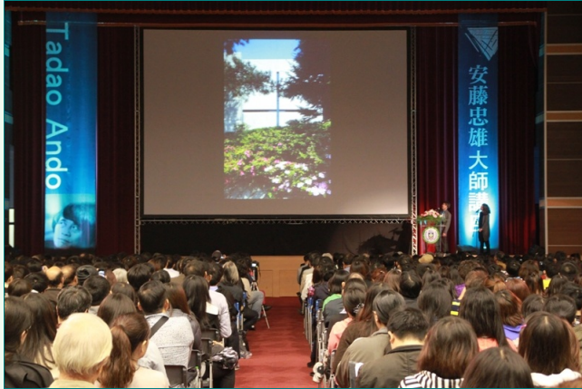
圖說：國際建築大師安藤忠雄建築大師在亞洲大學演講，吸引眾多學生、民眾參加，現場座無虛席。