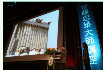
圖說：安藤忠雄建築大師在亞洲大學演講，勉勵年輕的學生走出台灣看世界。

亞洲大學校長蔡進發說，亞洲大學藝術館為安藤忠雄在全世界大學內的第一個作品，同時也是安藤在台灣的第一個作品，如此完美的作品，需要一位有遠見的業主如蔡創辦人，以及一位偉大的建築師。他希望大家能進入藝術館親自體會安藤忠雄建築的質樸與簡潔，另外他希望亞洲大學藝術館未來可以作為社區、國內藝術家、文創的基地和國際接軌的平台。