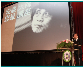
圖說：國際建築大師安藤忠雄在亞洲大學演講，亞洲大學蔡校長海創辦人致詞。

安藤忠雄建築大師強調，亞大藝術館不僅是台灣的寶貝，還要是全世界的寶貝，他勉勵年輕學生做好時間管理，到處旅行學習。